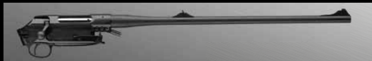
04 // СТВОЛ S202 ПОЛНОСТЬЮ ВЫВЕШЕН. В ЭТОМ И СОСТОИТ ОДИН ИЗ СЕКРЕТОВ ВЫДАЮЩЕЙСЯ ТОЧНОСТИ S202.