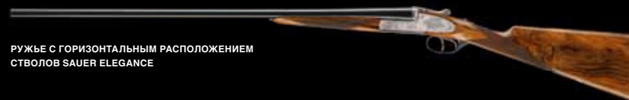
РУЖЬЕ С ГОРИЗОНТАЛЬНЫМ РАСПОЛОЖЕНИЕМ СТВОЛОВ SAUER ELEGANCE