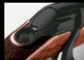
01 // УНИКАЛЬНЫЙ БЕСШУМНЫЙ ПРЕДОХРАНИТЕЛЬ

Винтовка SAUER 202, ставшая важной вехой в дизайне спортивных и охотничьих винтовок, как никто другой является воплощением чистой элегантности и точности. Используется ли она в горячей борьбе стрелковых матчей в Скандинавии, Австрии или Италии, во время охотничьих экспедиций в самых тяжелых условиях, или в качестве постоянного компаньона при охоте с вышки, преследовании оленя или на загонах: SAUER 202, благодаря своей современной конструкции и возможности адаптации отлично справится с любой задачей.