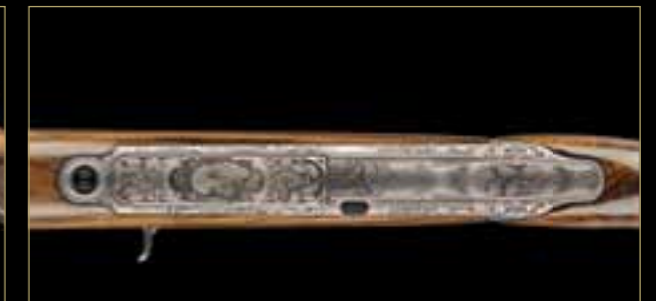
05 // S 303 „В дубах“ Детализация: классический орнамент из дубовых листьев сочетается с детальным изображением кабана на крышке магазина.