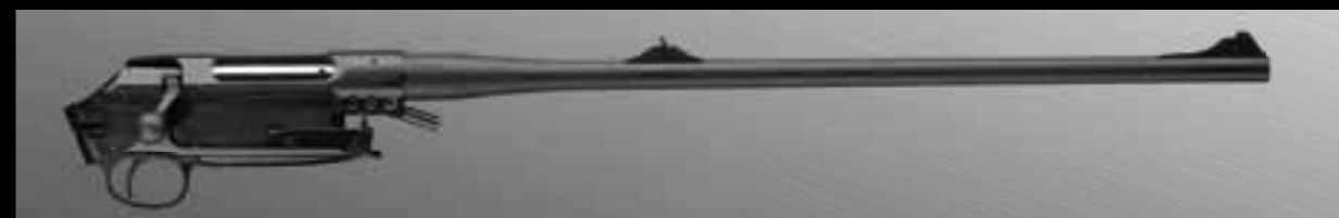
04 // СТВОЛ S202 ПОЛНОСТЬЮ ВЫВЕШЕН. В ЭТОМ И СОСТОИТ ОДИН ИЗ СЕКРЕТОВ ВЫДАЮЩЕЙСЯ ТОЧНОСТИ S202.