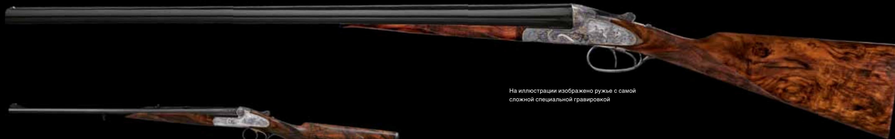
На иллюстрации изображено ружье с самой сложной специальной гравировкой