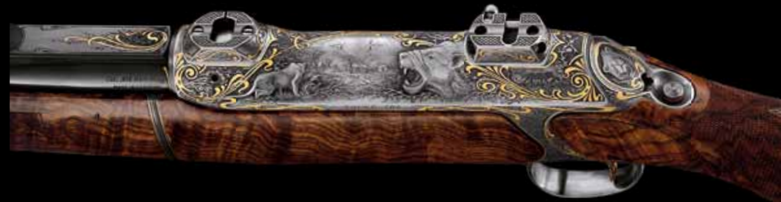
03 // S202 TAKE DOWN „Людоеды из Цаво“ История о львах-людоедах с берегов реки Цаво, переданная с помощью техники рельефа, инкрустации золотом и тончайшей гравюры булино.