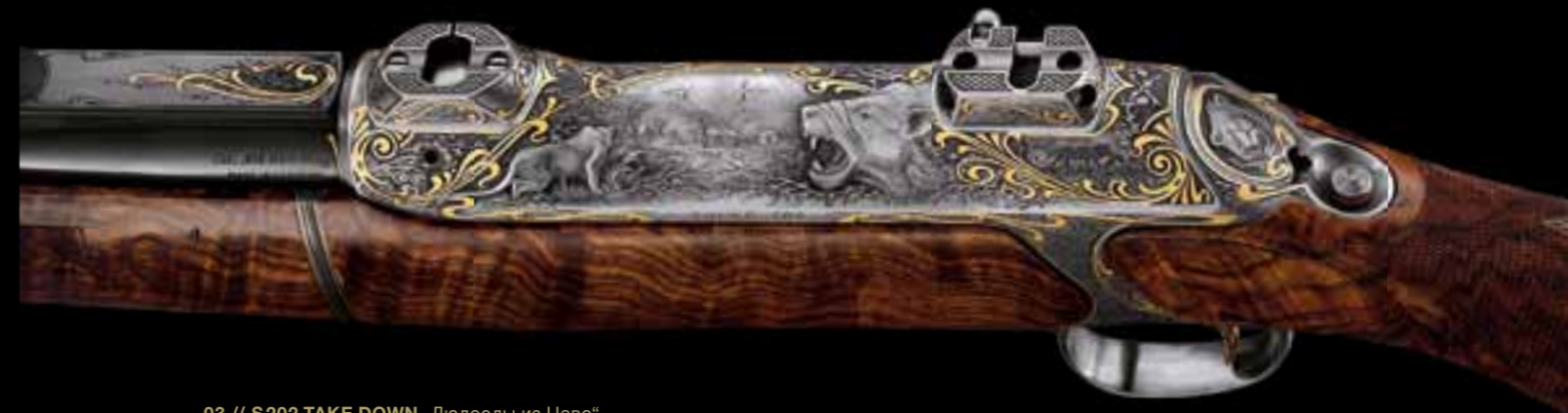
03 // S202 TAKE DOWN „Людоеды из Цаво“ История о львах-людоедах с берегов реки Цаво, переданная с помощью техники рельефа, инкрустации золотом и тончайшей гравюры булино.