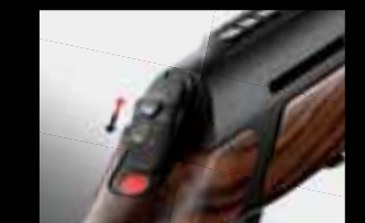
05 // РУЧНОЙ ВЗВОД SCS®