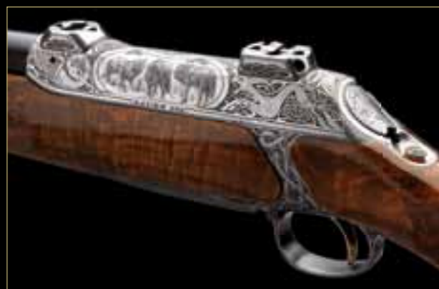
01 // S202 „Кельтские воины“ Аутентичный кельтский орнамент и анималистический сюжет с притаившимися волками, выполненный в технике булино.

Наши оружейники, ложевщики и граверы украсят каждый SAUER в соответствии с вашими пожеланиями. Тематические гравюры, которые являются нашей фирменной изюминкой, превращают оружие в предмет искусства с его собственной историей. Уникальные работы, такие как „Людоеды из Цаво“, „Вершина пищевой цепочки“ и „Гладиатор“ воплощают в себе идеальное сочетание творческого вдохновения и мастерства.