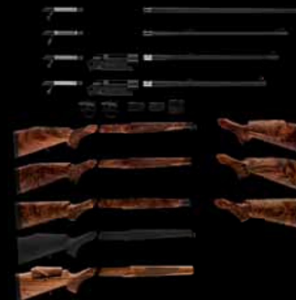
03 // МОДУЛЬНАЯ КОНСТРУКЦИЯ ПРЕДЛАГАЕТ МНОЖЕСТВО КОМБИНАЦИЙ ДЛЯ КАЖДОЙ СИТУАЦИИ