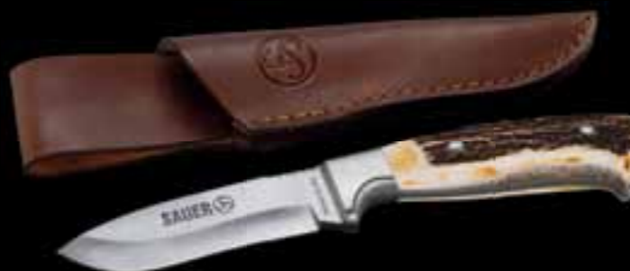
SAUER // НОЖ „ОЛЕНИЙ РОГ“ Клинок типа „Ball Point“ длиной 10 см из стали Сандвик, закаленной до 60 HRC // Накладки на рукояти из оленьего рога // Упор для пальца из нейзильбера // Ножны из плотной кожи