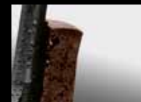
03 // ПОКРЫТИЕ НИТРОВОНД-Х®