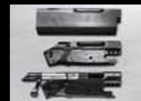
02 // ФРЕЗЕРОВАННЫЙ ИЗ ЦЕЛЬНОЙ ПОКОВКИ РЕСИВЕР