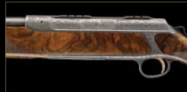
04 // S 303 „Вершина пищевой цепочки“ Схватка волка и гризли за тушу мертвого оленя увековечена в технике булино и обрамлена рельефным кельтским орнаментом.