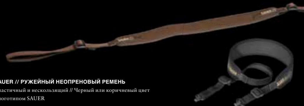
SAUER // РУЖЕЙНЫЙ НЕОПРЕНОВЫЙ РЕМЕНЬ Эластичный и нескользящий // Черный или коричневый цвет с логотипом SAUER