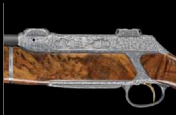
02 // S 202 TAKE DOWN „Африканское приключение“ „Большая пятерка“ изображенная в технике высокого рельефа.