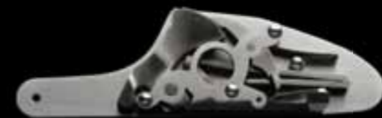
Легендарный отъемный замок на боковой доске Sauer & Sohn