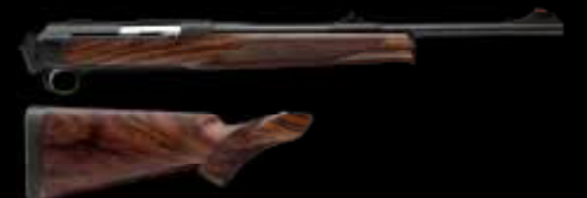
01 // КОМПАКТНЫЙ И УДОБНЫЙ

БЕЗОПАСЕН В ОБРАЩЕНИИ. МОМЕНТАЛЬНО ВСКИДЫВАЕТСЯ. БЕЗУПРЕЧНАЯ ТОЧНОСТЬ.