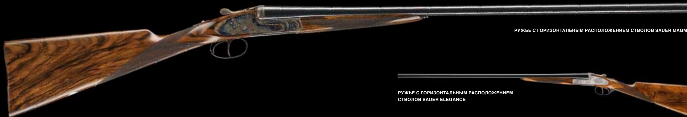
РУЖЬЕ С ГОРИЗОНТАЛЬНЫМ РАСПОЛОЖЕНИЕМ СТВОЛОВ SAUER MAGMA

Более 100 лет назад компания Sauer & Sohn создала символ совершенства, а сегодня ружью Meisterwerk с помощью высокого оружейного мастерства подарили новую жизнь. В настоящее время это единственное в мире ружье с легендарными замками на боковых досках Sauer & Sohn – единственными замками, в которых геометрия шептал построена по законам теоремы Фалеса. Сделанное полностью по индивидуальному желанию клиента, это оружие является шедевром наследия, покоряющим своего владельца уникальным очарованием.