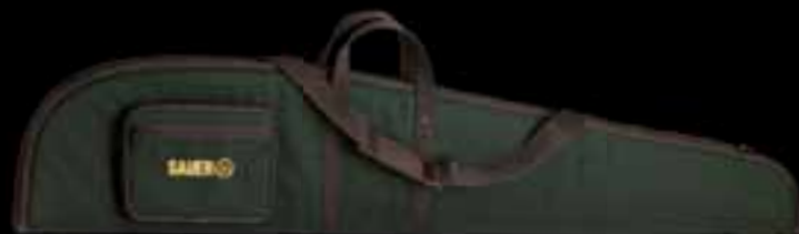
SAUER // МЯГКИЕ ОРУЖЕЙНЫЕ ЧЕХЛЫ Высококачественная кордура // Отдельный карман для патронов и ремень для ношения // Максимальная длина оружия 122 см