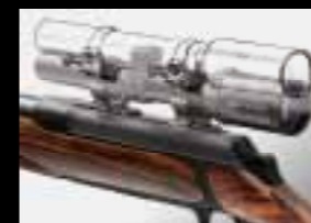
02 // 8/ISI MOUNT® КРЕПЛЕНИЕ