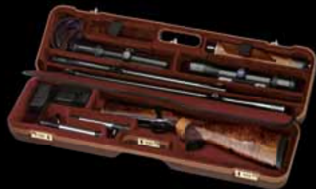
SAUER // КЕЙСЫ ДЛЯ ОРУЖИЯ TAKE DOWN Надежная защита с противоударной конструкцией ABS // Оборудован внутренними отделениями для оружия, 2 стволов, 2 затворов, 2 оптических прицелов с размером объектива до 56 мм, ремня, магазинов и набора для чистки // Трехразрядная комбинация замка // Защитное покрытие из кордуры // Размеры (Длина/Ширина/Высота): 90,5x26x14,5 см