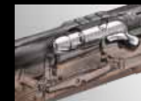
04 // INTRA LOCK® ПРЕДО- ХРАНИТЕЛЬ ЗАТВОРА