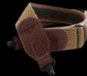
SAUER // РУЖЕЙНЫЙ РЕМЕНЬ NATARI Ткань с кожаными вставками // 5 см ширины // Резиновые накладки на внутренней поверхности для надежной фиксации // Вшитые антабки для крепления на S 202, S 202 TD и S 303