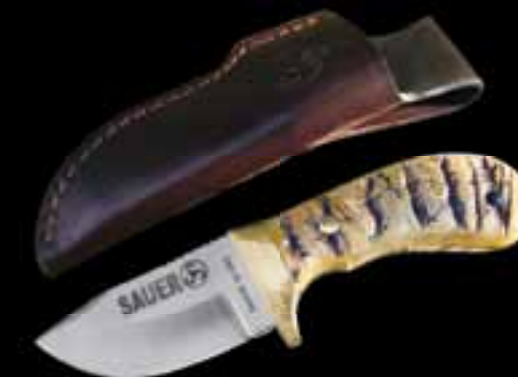
SAUER // НОЖ „МУФЛОН“ Накладки на рукояти из настоящего рога муфлона // Клинок длиной 7,5 см из стали Сандвик, закаленной до 60 HRC // Гарда из нейзильбера // Обух с насечкой // Ножны из коричневой кожи