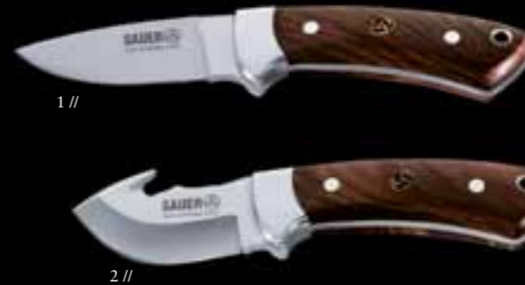
SAUER // ОХОТНИЧИЙ И РАЗДЕЛОЧНЫЙ НОЖИ Нержавеющая сталь 440 // Накладки из ореха на рукояти 1 // Охотничий нож с фиксированным клинком длиной 8,5 см // Ножны из плотной кожи 2 // Разделочный нож с клинком 7 см и крюком для снятия шкуры // Ножны из плотной кожи