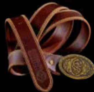
SAUER // РЕМЕНЬ С ПРЯЖКОЙ Ремень из буйволиной кожи, 110 см // Регулируемый // Латунная пряжка с искусным мотивом из переплетенных букв