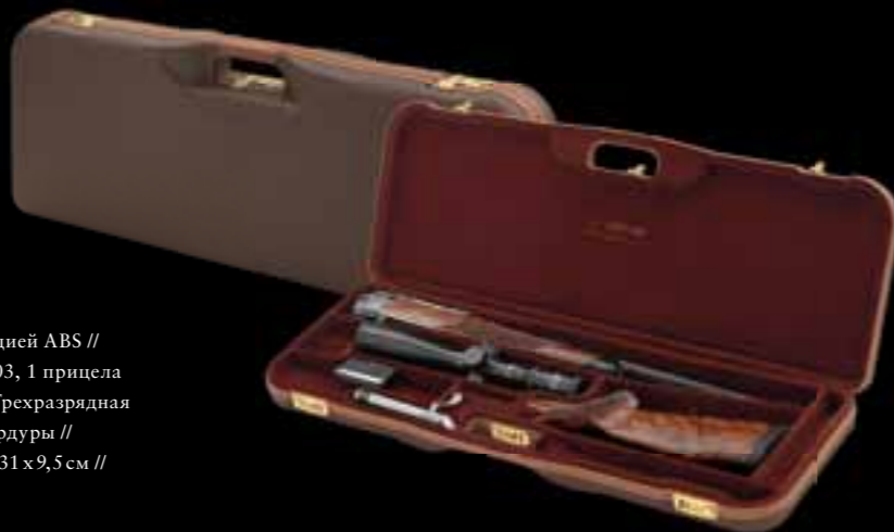
SAUER // КОРОТКИЙ КЕЙС ДЛЯ S 202 / S 303 Надежная защита с противоударной конструкцией ABS // Оборудован отделениями для одного S 202/S 303, 1 прицела с размером объектива до 56 мм и аксессуаров // Трехразрядная комбинация замка // Защитное покрытие из кордуры // Размеры (Длина/Ширина/Высота) S 202: 89,5x31x9,5 см // S 303: 90,5x31,5x10 см