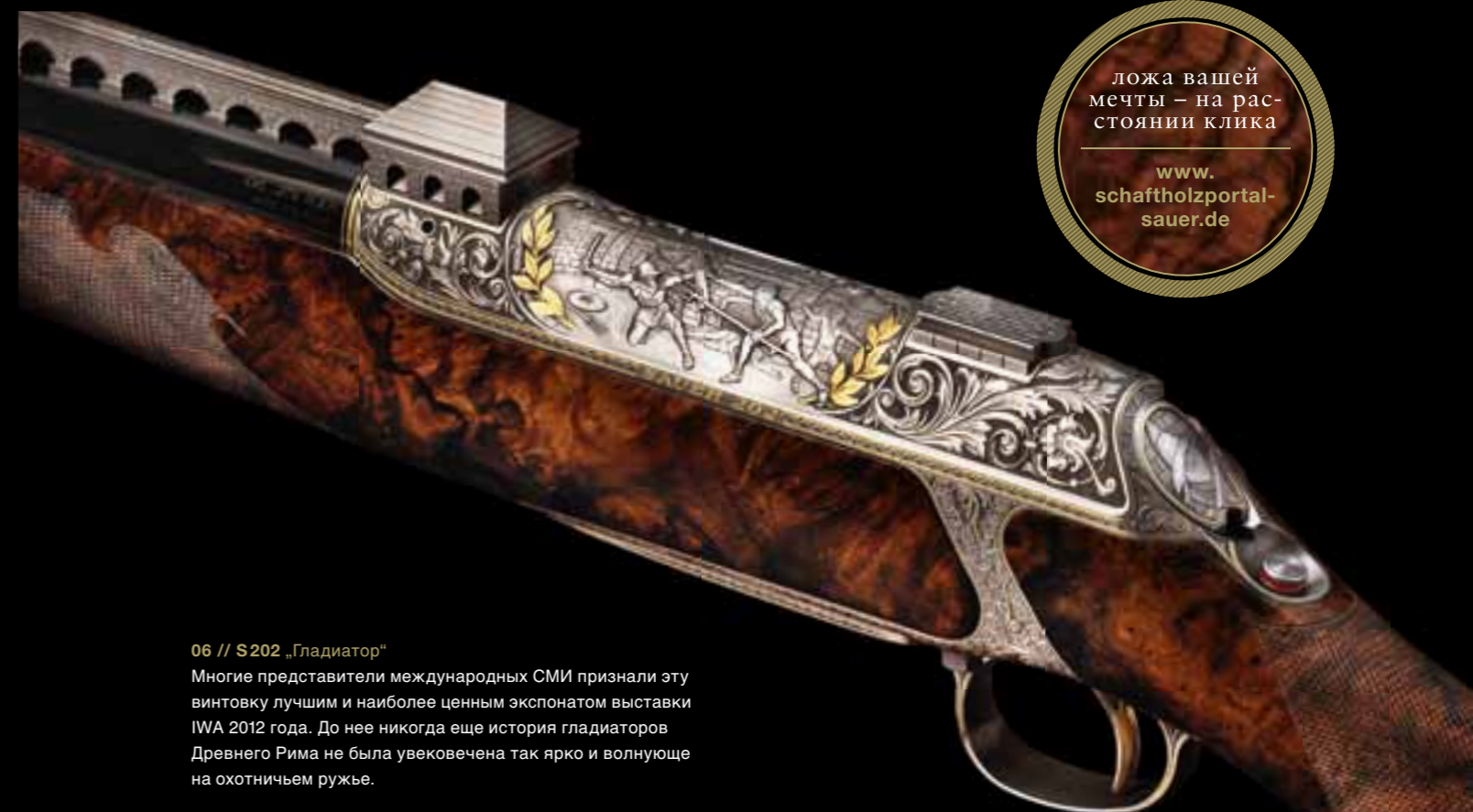
06 // S202 „Гладиатор“ Многие представители международных СМИ признали эту винтовку лучшим и наиболее ценным экспонатом выставки IWA 2012 года. До нее никогда еще история гладиаторов Древнего Рима не была увековечена так ярко и волнующе на охотничьем ружье.