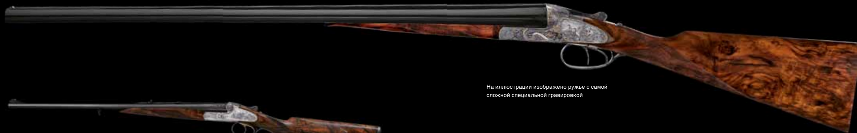
На иллюстрации изображено ружье с самой сложной специальной гравировкой