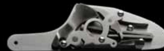
Легендарный отъемный замок на боковой доске Sauer & Sohn